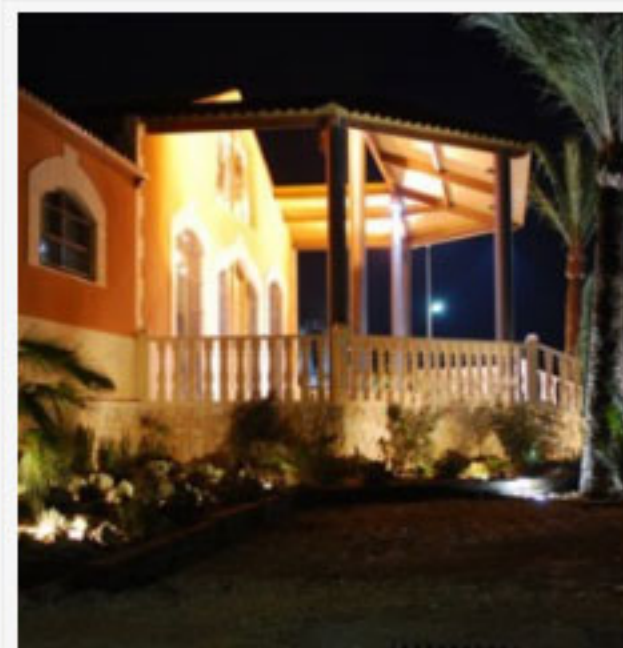
Heretat de Cesilia