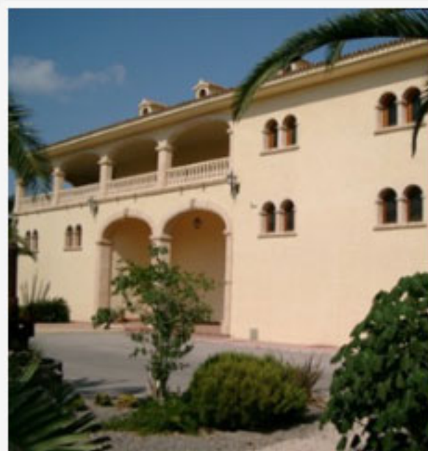
Bodegas Enrique Mendoza