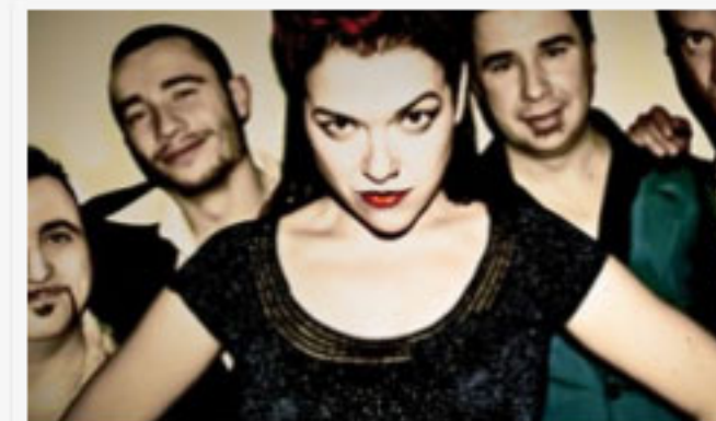
The Night Shouters

Con un sonido contundente pero elegante, llegan a Alfaz del Pi para ofrecer un repertorio basado en el Rhythm & Blues de los años 50s y 60s. Desde baladas suaves al trepidante Rock & Roll, el grupo invita a disfrutar canciones que reflejan la cultura musical retro-americana con covers de Ruth Brown, Etta James o Little Walter, entre otros.