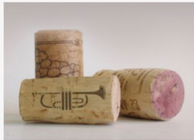
Ciclo ViNits in concert

Casi tres siglos después, los vinos de Heretat de Cesilia combinan el arte de una elaboración tradicional, con los más modernos medios tecnológicos, para lograr un resultado único: vinos de calidad ya reconocidos por la prensa y crítica especializada.